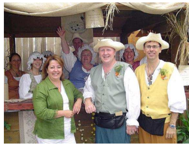
Équipe de « Goûtez Lotbinière »