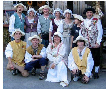
Équipe de la TACA et Ferme Muranlain