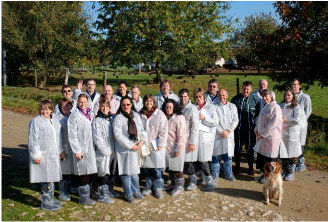
Une partie de notre groupe