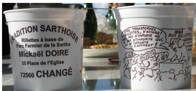
La spécialité sarthoise