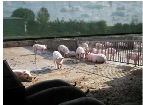
Le parc d'exercice