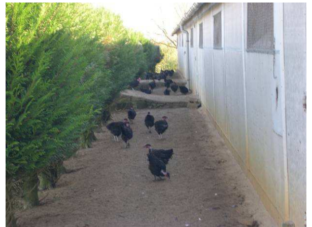
Le parcours extérieur