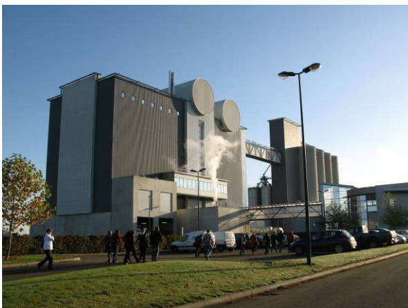
L'usine d'aliment ALIFEL